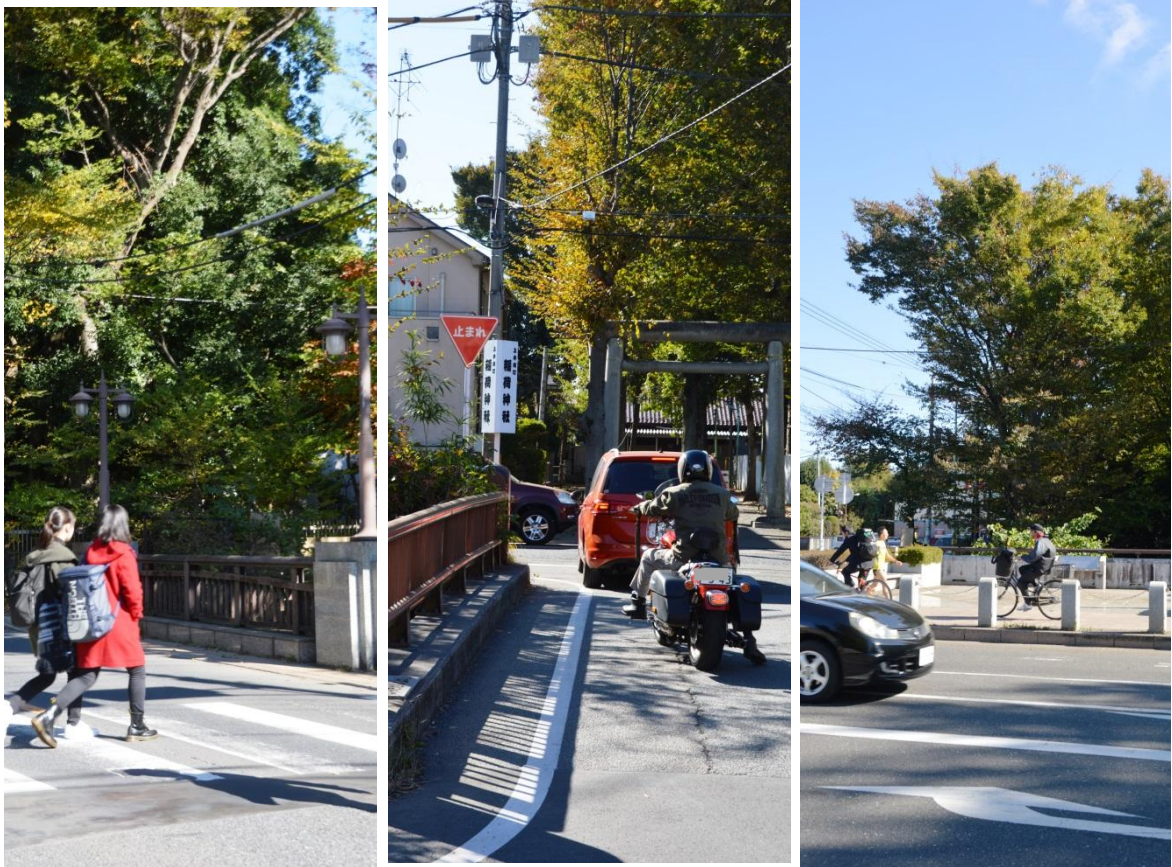
小平の昔を今に……玉川上水に架かる橋＝久右衛門橋(左)＝八左衛門橋(中)＝喜平橋(右)