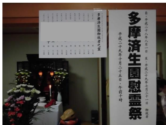
▶ こだいら社会福祉士会設立総会 ▶ 物故者慰霊祭