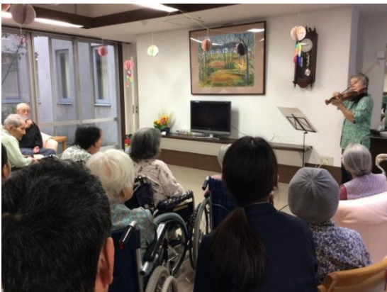
▶ 小平市立第七小学校交流訪問講話 ▶ バイオリンボランティアコンサート