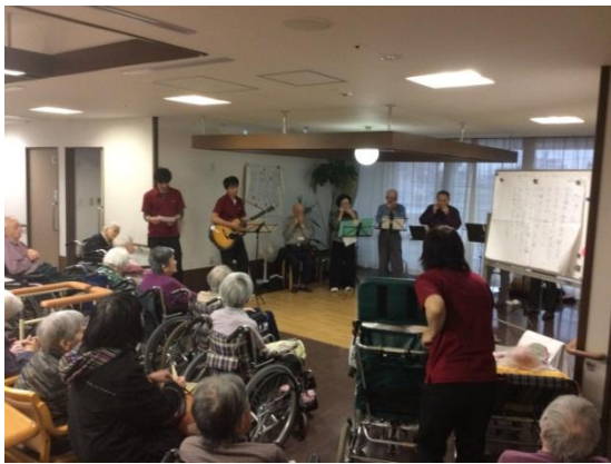
▶ ユニットフロアー流しろうめん ▶ ハモニカボランティアコンサート