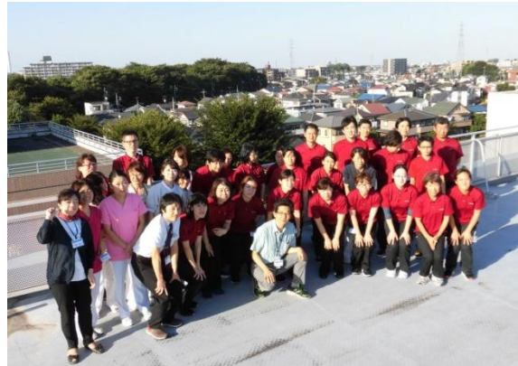
秋晴れのある日屋上集合