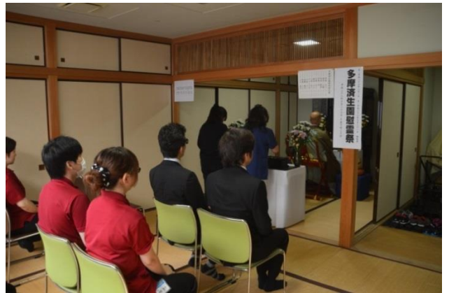
▲10月26日 多摩済生園物故者慰霊祭