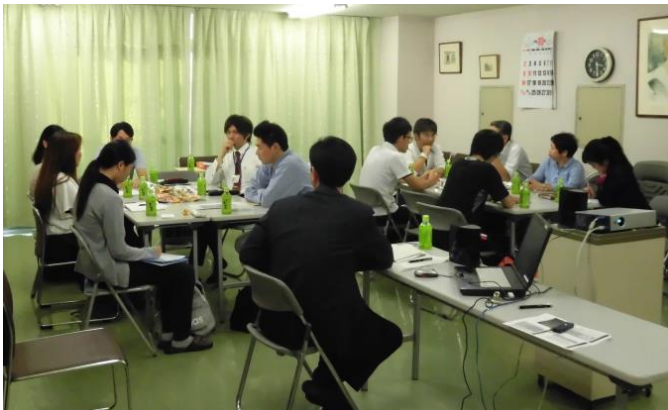
▲10月7日 東社協北北ブロック生活相談員研修委員会