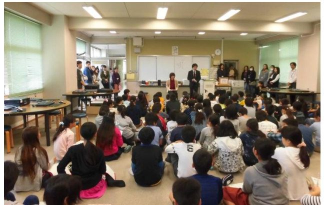
▲10月29日 小平市立第七小学校交流学习講話