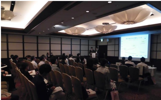
▲9月30日 アクティブ福祉 in 東京口演発表