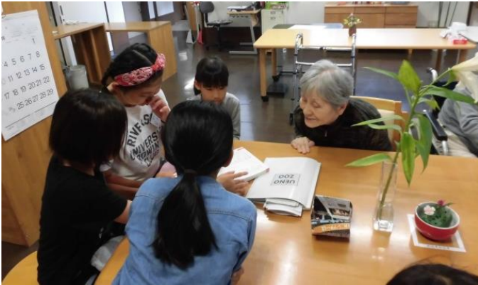
▲10月7日 小平市立第七小学校・5年生交流訪問

■ 11月 職員秋の健康診断・ストレッチ(7、18日) / 小平市立第六中学校生徒職場体験(8日) / 全国社会福祉大会々長表彰を受く / 施設長他2名(11日) / 認知症対応型通所介護事業所実地指導指摘事項改善状況報告書提出(15日) / いちよう祭り(20日)