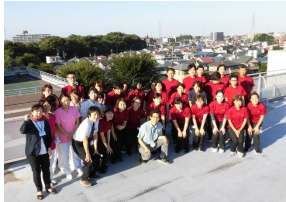
秋晴れのある日屋上集合